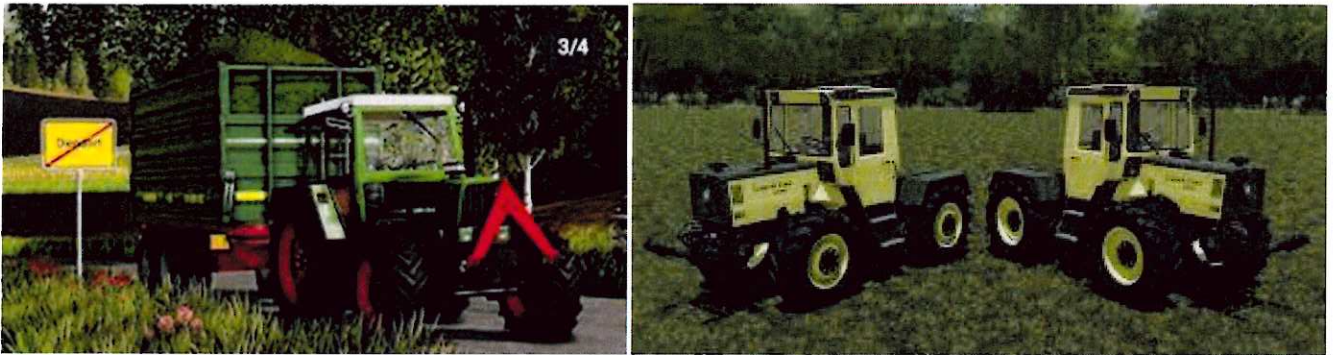
Bilder :Fahrzeugliste ändern , "Rangordnung" – GIANTS-Software – Forum (giants-software.com)

Der Landwirtsafsts Simulator 22 kam am 20. November 2021 auf den Markt. Der Landwirtschaft Simulator hat über 100 echte Traktormarken und ca. 400 Fahrzeuge. Er kostet 7,49€ (in 2024) sonst kostet er 14,99€. Und die Abkürzung ist Ls22. Es geht darum Landwirtschaft zu machen und man kann eigene Produktionen bauen und seine Farm ausbauen. Man kann Felder kaufen. Der Ls22 wurde von Giants Software erfunden. Es gibt den Ls22 für PC und alle Konsolen außer Nintendo Switch. Er wurde 6 Millionen Mal verkauft. Der Ls22 hat 5 Millionen Fans. Den Ls22 spielen ca. 4 Millionen Menschen pro Tag.